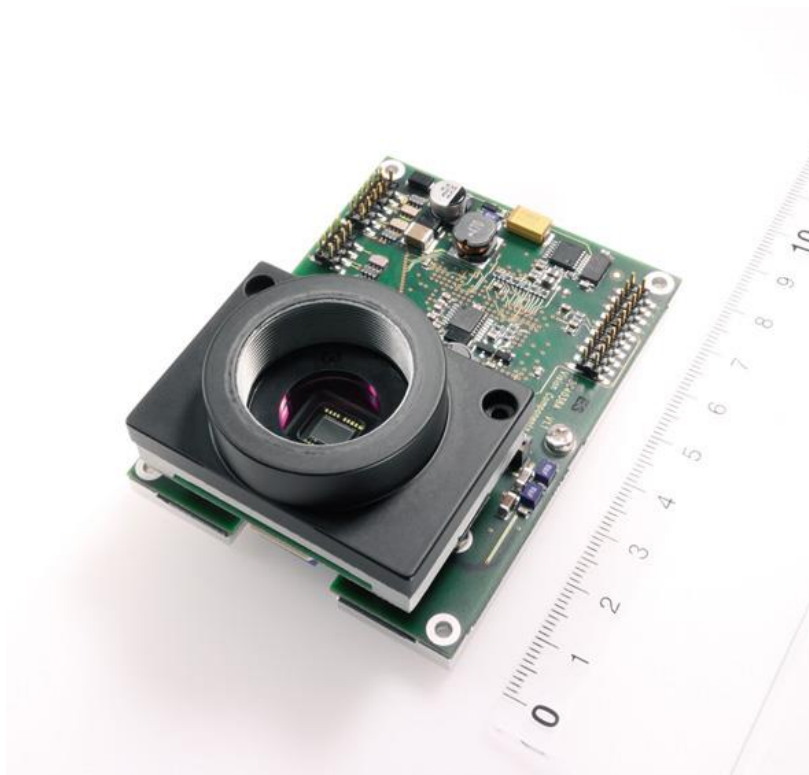
Bild 4: Leistungsstarke Smart Kamera VCSBC4018 von Vision Components