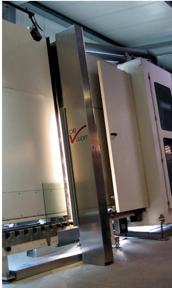
Bild 1: Das OBV-Scan-System ist in die Isolierglas-Fertigungslinie integriert

suchten Glasscheibe zusammensetzt. Die Anlage hält selbst mit der maximalen Taktrate der Produktionsstrecken Schritt (ca. 1 m/s) und bremst somit nicht den Produktionsablauf.